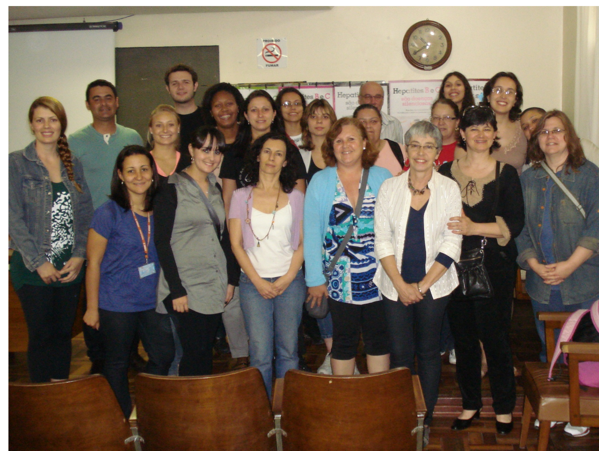
Hospital Sanatório Partenon - 2011

Visitas locais com explanação e discussão acerca do histórico e da atuação institucional. Projeto de extensão elaborado e executado pelos alunos PET Conexões de Saberes - Cenários de Prática e de Estágios Curriculares Noturnos em realização de setembro a dezembro/2011. Os encontros ocorrem aos sábados, uma vez por mês (setembro: 24, outubro: 15, novembro: 19, dezembro: 10; com início às 9h e encerramento às 17h). Este curso conta com 24 alunos dos cursos noturnos da UFRGS: APSS-Bacharelado em Saúde Coletiva, Odontologia, Psicologia, Serviço Social que são acompanhados por docentes da Saúde Coletiva.